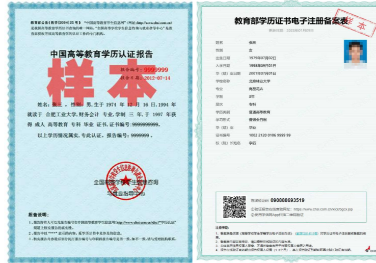
中国高等教育学历认证报告样本。

凡提交虚假材料导致无法注册的, 后果由考生本人负责。《中国高等教育学历认证报告》、《国(境)外学历认证书》申请时间约为20个工作日, 请考生妥善安排时间。